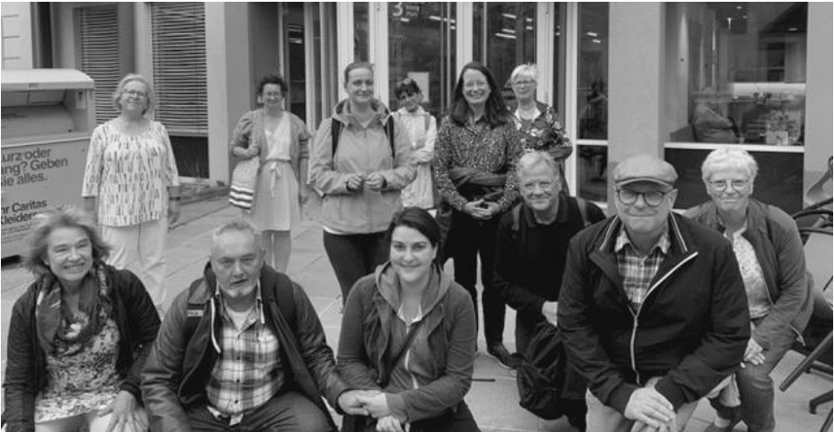
Die diesjährigen Teilnehmer bei ihrer ersten Einheit

Wenn Sie Fragen zum bischöflichen Seminar haben oder an der Ausbildung interessiert sind, dann wenden