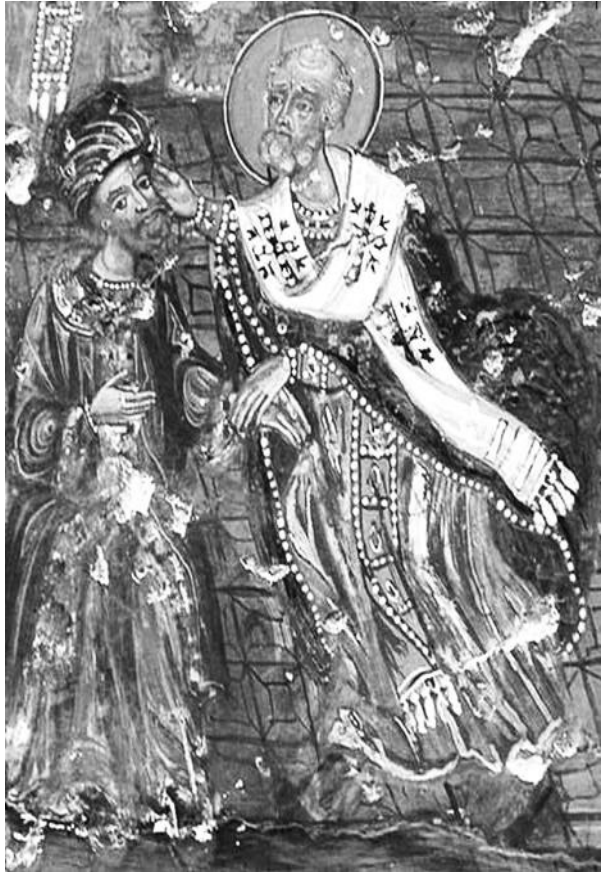
Ohrfeigen und - je nach Quelle - auch Bartziehen, Treten und Nasenbrechen gehören nicht zu unserer Tradition (Nikolaus von Myra und Arius am Ersten Konzil von Nicäa). Detail eines Frescos (14. Jhd.) aus dem Sumera-Kloster, Türkei)

Möge der Heilige Geist unsere alt-katholische Kirche auf ihrem Weg begleiten und sie leiten, damit die Synode Früchte trägt und dazu beiträgt, dass wir vereint und erneut unserer Aufgabe nachkommen