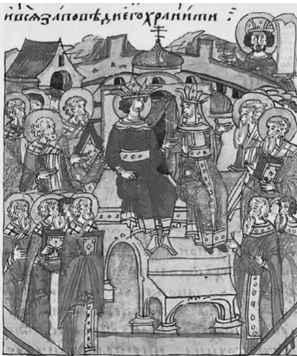
Zweites Konzil von Nicäa (mit Konstantin VI und Kaiserin Irene). Detail aus der Illustrierten Chronik Ivan des Schrecklichen (16. Jhd.)

Die altkatholische Kirche, geprägt von einer offenen Haltung und einem starken persönlichen Engagement, sieht die Synode selbst, aber auch die Periode davor als eine Zeit des Wachstums und der Begegnung. Durch die Auseinandersetzung mit den einzelnen Anträgen und Initiativen können alle altkatholischen Gemeinden miteinander in Dialog treten bzw. diesen vertiefen. Denn eine Synode bietet als ein zentrales Element unserer Kirche allen, die daran aktiv oder passiv teilnehmen, die Möglichkeit, gemeinsam über wichtige Fragen zu