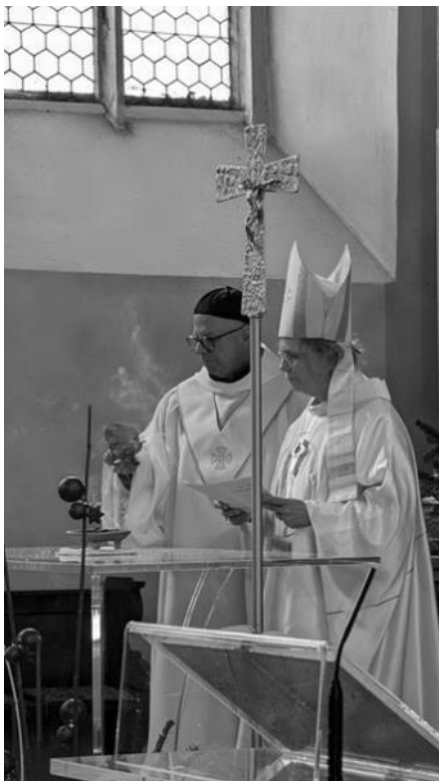
Neuer Altar und Ambo dank einer zweckgewidmeten Erbschaft

A m 28. Jänner 2024 haben wir den neuen Altar (ein)geweiht. In dieser Feier wurde der Altar erst mit Taufwasser besprengt und dann mit Chrisam, dem Zeichen der Königswürde, gesalbt. Danach wurde Weihrauch darauf verteilt, in der Hoffnung, dass unsere Gebete wie dieser Weihrauch zu Gott aufsteigen mögen. Mit dem Licht der Osterkerze wurden anschließend die Kerzen um den Altar entzündet, mit der Bitte, dass das Licht Christi im Leben aller derer erstrahlt, die am Tisch des Herrn teilhaben.