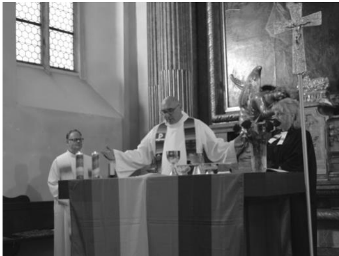
Drei Konfessionen, drei Geistliche

Die Altkatholische Kirche hat mit der Gleichstellung aller Geschlechter zu dieser Frage eine klare Position. Dies