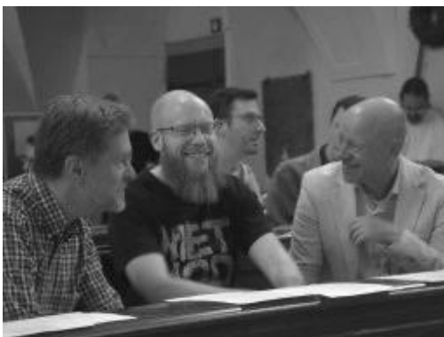
Drei Konfessionen, drei Laienvertreter

Seite der Unterdrückten und Verfolgten mit dem Ziel, Barrieren und Ungerechtigkeiten zu beseitigen.